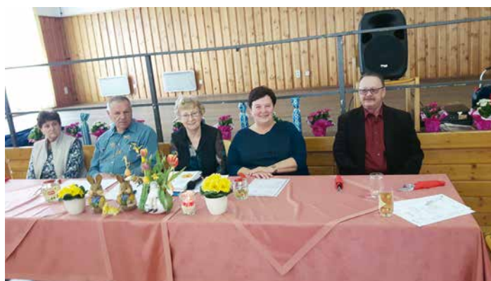
Der wiedergewählte Vorstand des Pensionistenverbandes