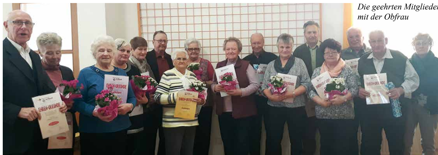
Die geehrten Mitglieder mit der Obfrau