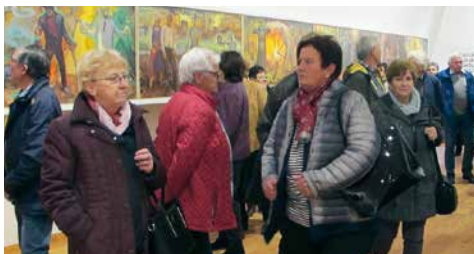
Unsere Gruppe bei der Führung im Museum