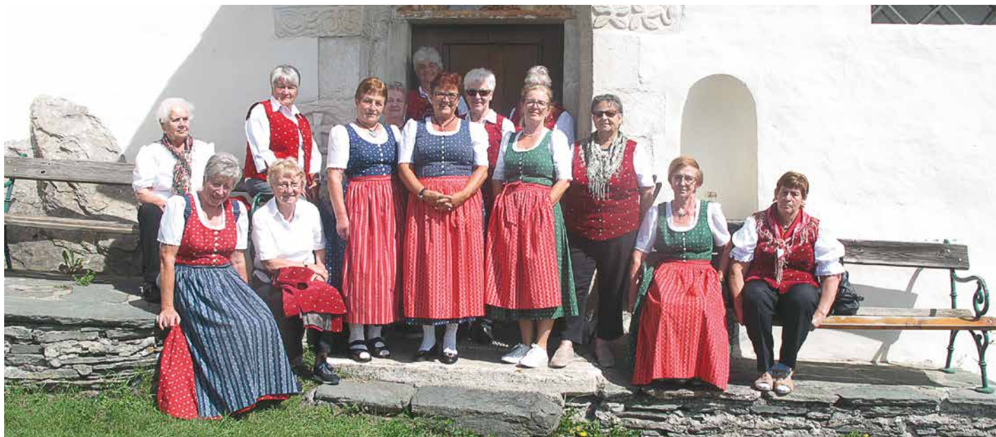
Vor der Kirche Maria Hohenburg