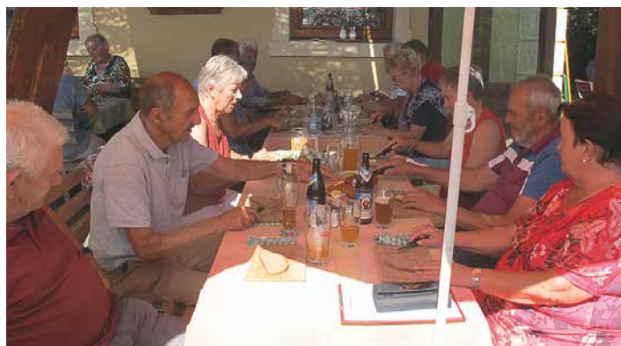
Die hungrigen Pensionisten beim Verzehr der Jause.