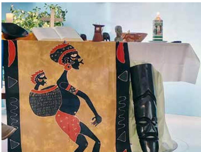
Frauen aus Nigeria haben die Liturgie vorbereitet.

Insgesamt haben 64 Personen miteinander gefeiert und eine Kollekte von € 1.300,- konnte an das Komitee überwiesen werden. Ein überragendes Ergebnis, welches in die verschiedensten Frauenprojekte einfließen wird. DANKE an alle großzügigen SpenderInnen.