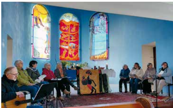
Danke an das Vorbereitungsteam

Wie schon seit vielen Jahren feierten wir Anfang März in der evangelischen Kirche den ökumenischen Weltgebetstag . Das heurige Thema lautete: „Kommt! Bringt eure Last.“